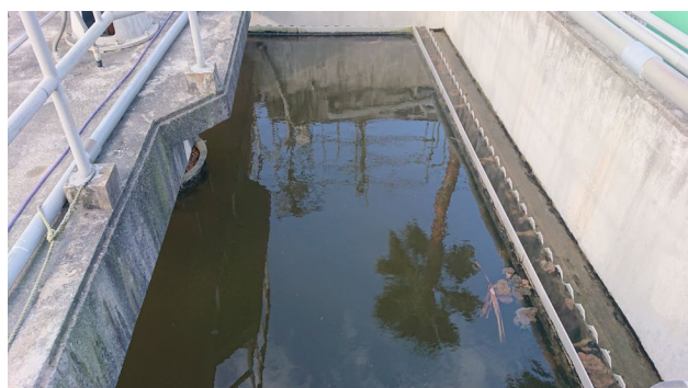
改善された沈殿槽