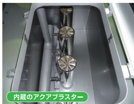
内蔵のアクアブラスター