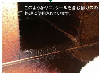
このようなヤニ、タールを含む排ガスの処理に使用されています。

導入してから、近隣苦情が発生したが、調べてみると脱臭機のスイッチが止められていた。改めてこの脱臭機の効果を実感した。