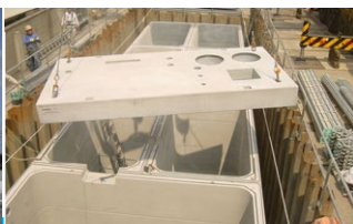
弁当工場の排水処理