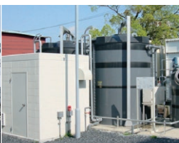
食堂及び鋳物油排水の処理