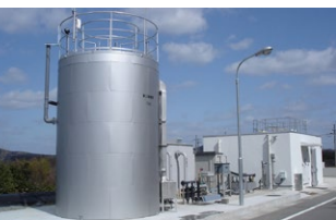
製パン工場排水の処理