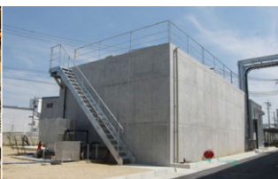
食品加工場の排水処理